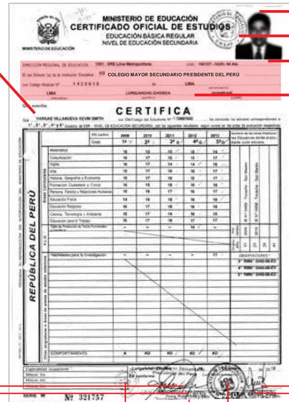
CERTIFICADO DE ESTUDIOS DE EDUCACIÓN SECUNDARIA ORIGINAL